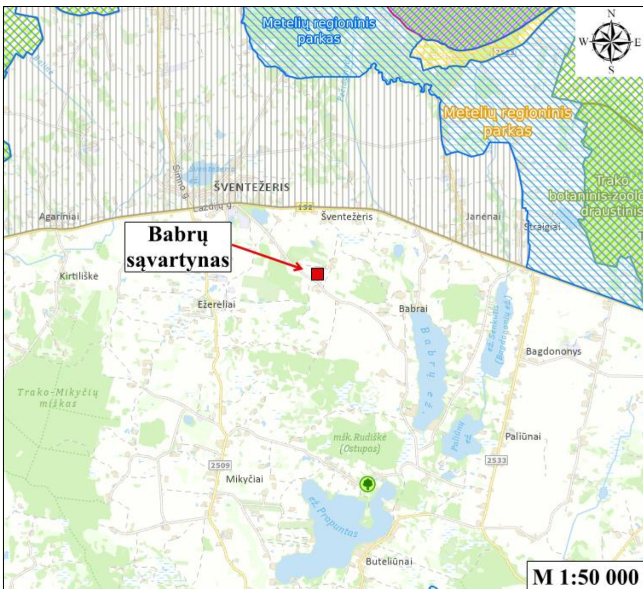
4.1 pav. Sąvartyno teritorijos apylinkių žemėlapis

Uždarytas Babrų sąvartynas Lietuvos geologijos tarnybos valstybinėje geologijos informacinėje sistemoje (GEOLIS) įregistruotas kaip potencialus geologinės aplinkos taršos židiny (PTŽ), kurio bendras pavojingumas geologinei aplinkai – didelis pavojus. Teritorijai suteiktas PTŽ Nr. 5205.